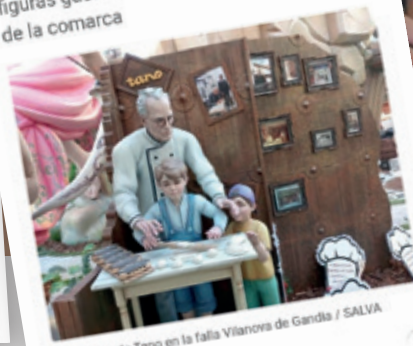
La escena de Tano en la falla Vilanova de Gandía

La comisión rinde homenaje a una de las figuras gastronómicas más destacadas de la comarca