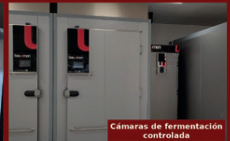
Cámaras de fermentación controlada