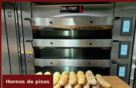
Hornos de pisos